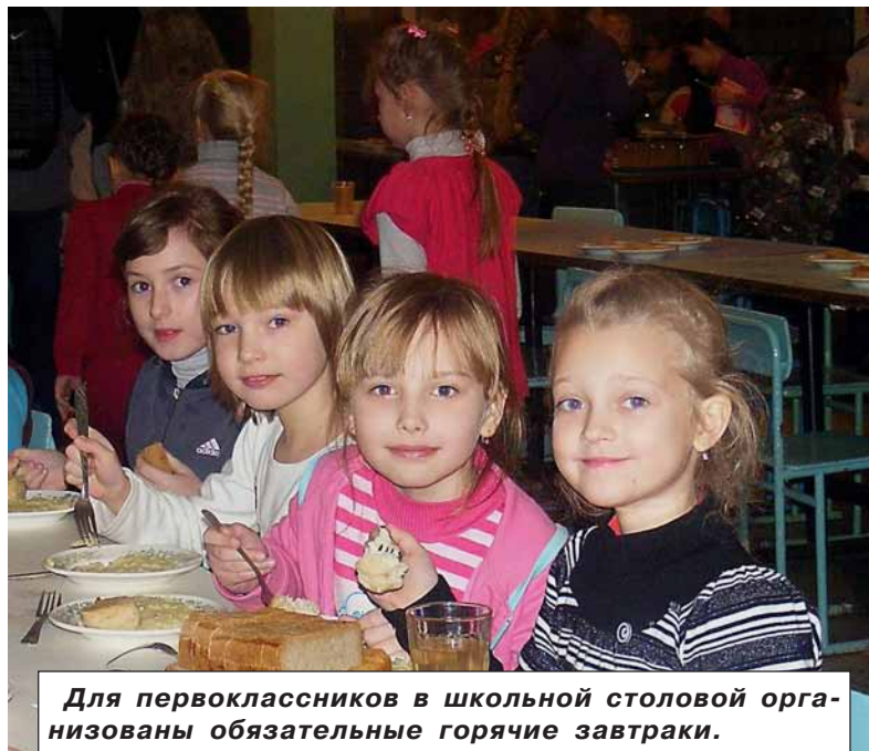
Для первоклассников в школьной столовой организованы обязательные горячие завтраки.

или о том, как быстро и качественно накормить сотни детей