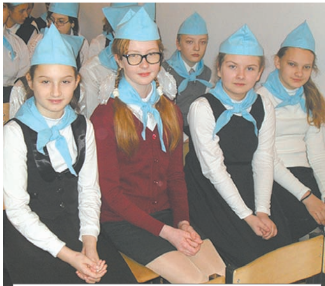
Участники детской общественной организации «Юные жуковцы»

Имя маршала Лосика вместе с именами других героев навсегда вписано в историю страны как пример мужества и силы духа. Кстати, в настоящее время возобновилась серьезная работа, направленная на то, чтобы Ярцеву присвоили почетное звание города воинской славы.