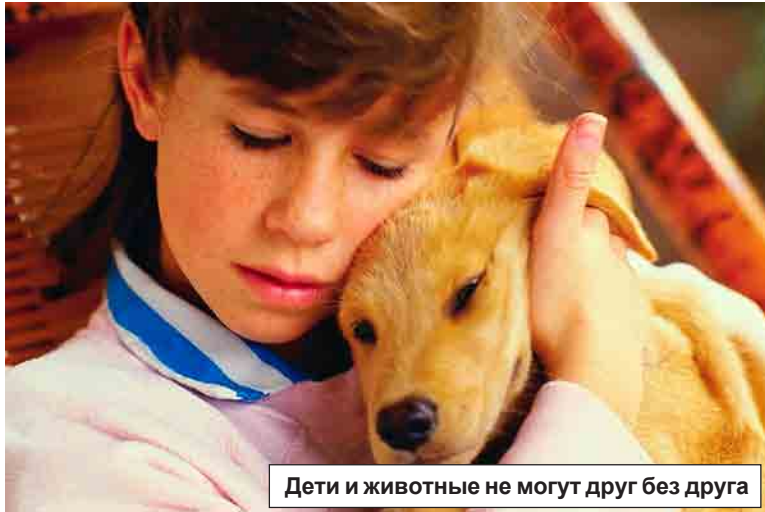
Дети и животные не могут друг без друга