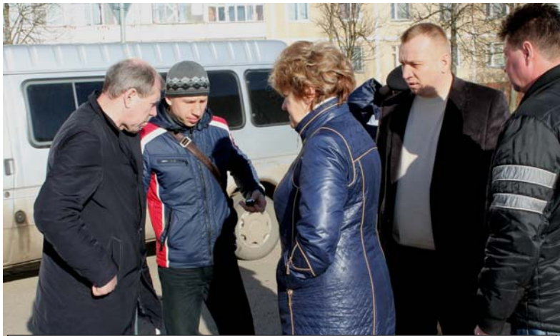
Комиссия знакомится с ямочным ремонтом на ул.Автозаводской

рода». - Скоро она будет готова и выйдет на чистку улиц. Где песок не возьмет техника, будем использовать людские резервы. На улицах, где из-за разросшихся деревьев уборочная техника не может подойти вплотную к бордюру, мы сначала обрежем кроны. Затем одновременно уберем и ветки, и песок. Такой подход считаю рациональным, он позволит не убирать дважды одну и ту же территорию и сэкономит бюджет