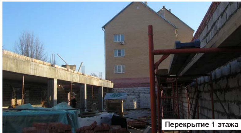
Перекрытие 1 этажа

Первые этажи домов, построенных в Ярцеве фирмами ООО «Инвесткапстрой» и ООО «Капитал», возводятся из розового кирпича. Вот и у очередного дома-трёхэтажки по улице М.Горького розовые стены поднялись уже выше забора, огораживающего строительство.