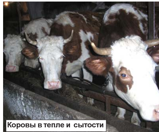
Коровы в тепле и сытости

СХПК «Ольхово» - одно из немногих хозяйств района, которое не допустило снижения общественного поголовья к уровню предыдущего