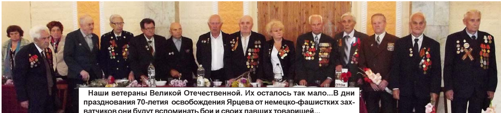
Наши ветераны Великой Отечественной. Их осталось так мало... В дни празднования 70-летия освобождения Ярцева от немецко-фашистских захватчиков они будут вспоминать бои и своих павших товарищей...