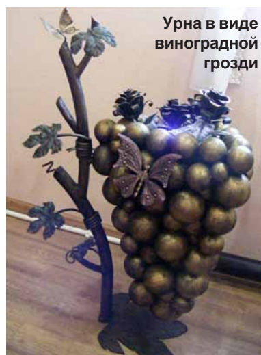
Урна в виде виноградной грозди

Количество заказов на кованые металлоизделия постоянно увеличивается, и это не случайно. Интерес к кузнечному делу в нашей стране возрастает. Возрождение древнего, почти исчезнувшего искусства на Руси сегодня имеет особый смысл. Искусствоковки металла не должно исчезнуть навсегда, уверены кузнецы. И, хотя в последние годы техника художественной