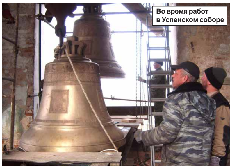
Во время работ в Успенском соборе