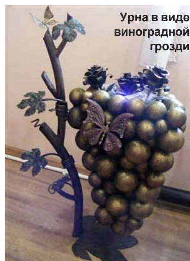
Урна в виде виноградной грозди

Количество заказов на кованые металлоизделия постоянно увеличивается, и это не случайно. Интерес к кузнечному делу в нашей стране возрастает. Возрождение древнего, почти исчезнувшего искусства на Руси сегодня имеет особый смысл. Искусствоковки металла не должно исчезнуть навсегда, уверены кузнецы. И, хотя в последние годы техника художественной