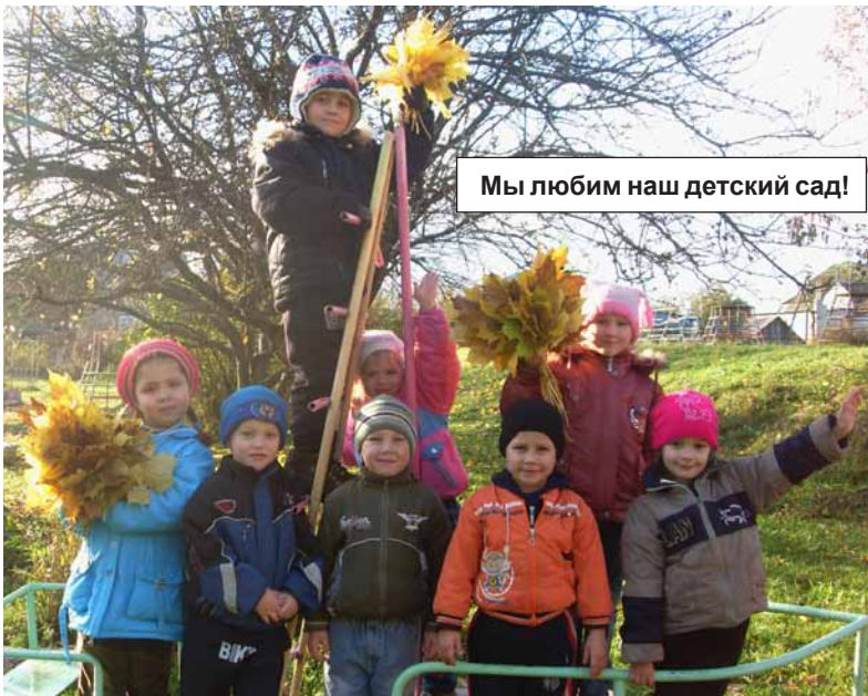
Мы любим наш детский сад!

в сумерках бытовых проблем старого Ярцева, которые не решаются годами