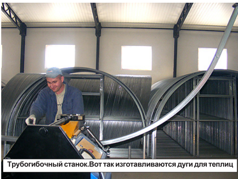
Трубогибочный станок. Вот так изготавливаются дуги для теплиц